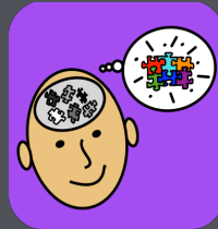
TCC de Niño

Descárgalas en el iTunes App Store para tu iPhone, iPad, iPad Mini, e iPod Touch