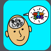
TCC de Adulto

Ciencia de la Acción Humana y Social para Avances Tecnológicos