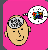
TCC de Joven